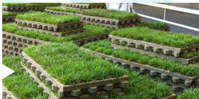
FIX & FERTIG ANGELIEFERT

Die Sofortlösung für begrünte Pkw-Parkplätze