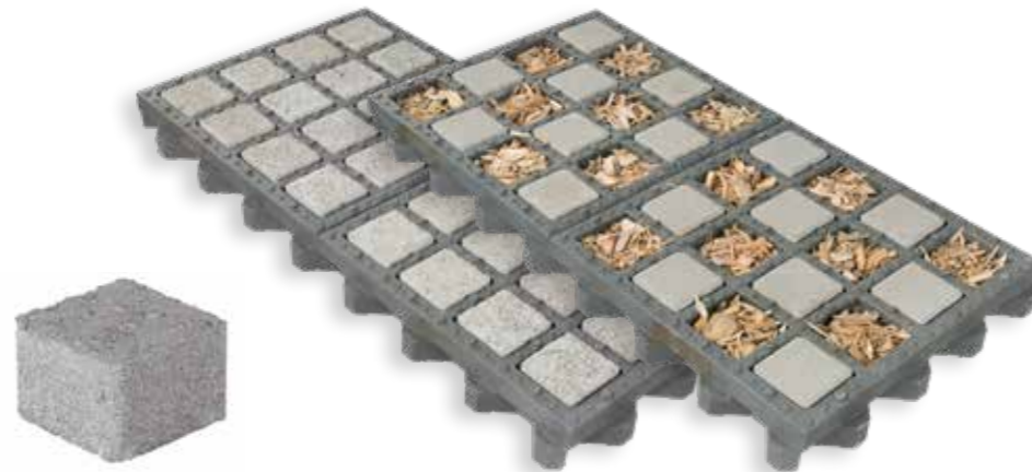
TTE® Pflasterstein GRIP

Zum Befüllen von 1 m 2 TTE® benötigt man 100 TTE® Pflasterstein GRIP Steine.